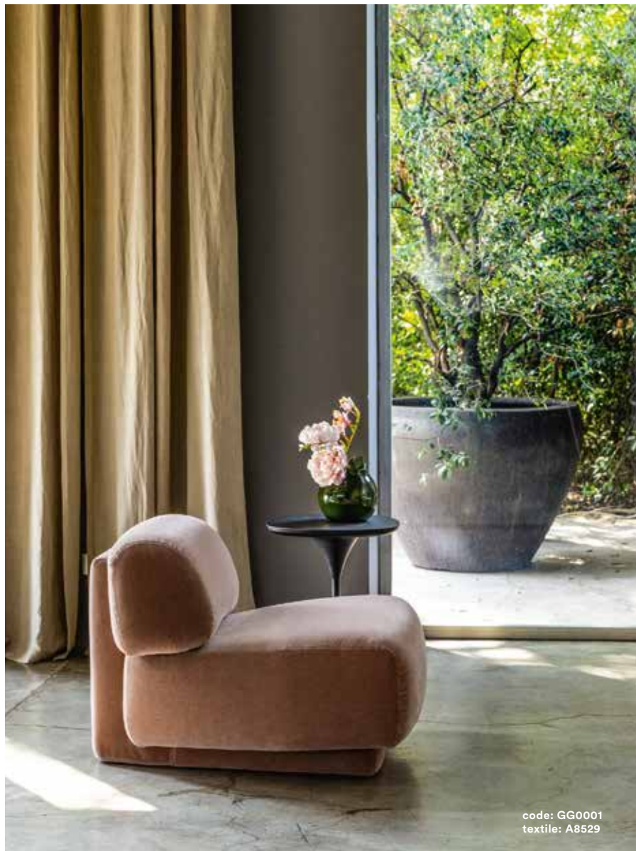
code: GG0001 textile: A8529