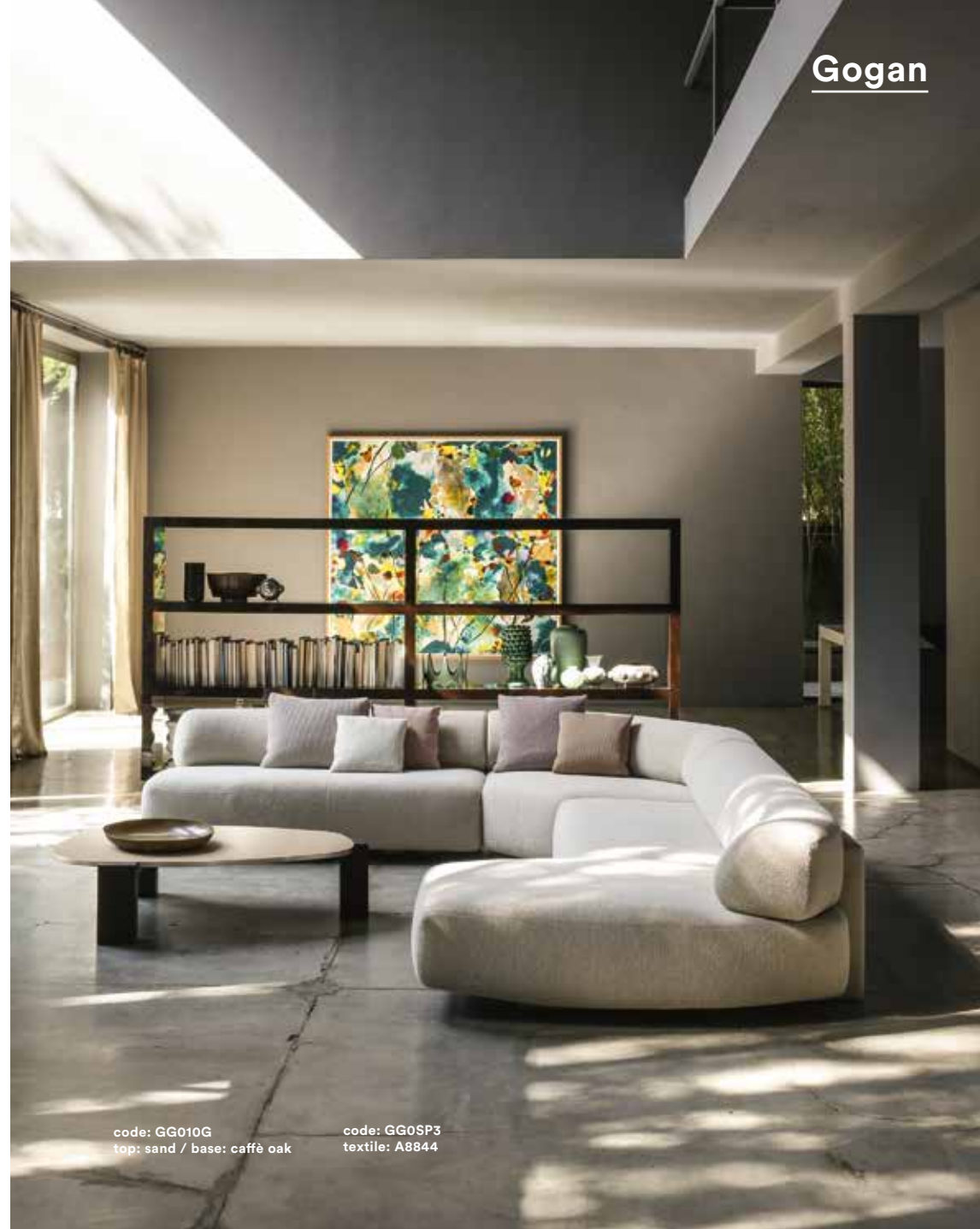
code: GG010G top: sand / base: caffè oak