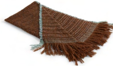
Gaia (terracotta tones)