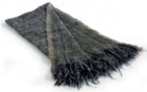
Dafne (grey tones)