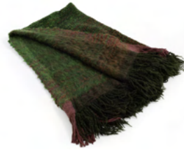
Dafne (green tones)