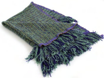
Gaia (green tones)