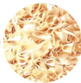
B005 pearl white RAL 1013 rose gold