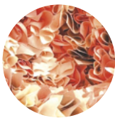
B004 sand Pant. 7529 rose gold