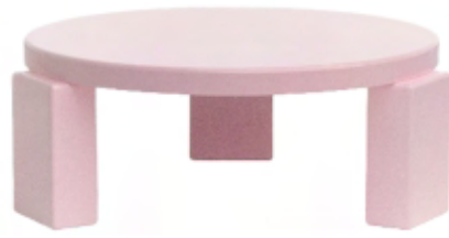
Table with a lightweight composite structure in polymeric and wooden materials. The legs are made of MDF and screwed to the structure. The coffee table is painted with a glossy lacquered finish.